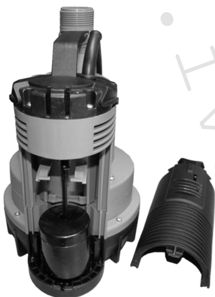
Obr. A: Čerpadlo s odkrytým plovákem