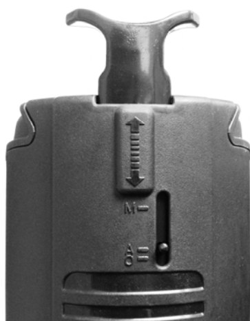
Obr. C: Táhlo s ukazatelem pro přepínání druhu provozu