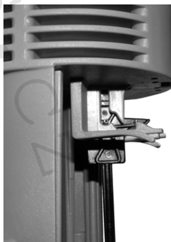
Obr. D: Detail zavěšení plováku