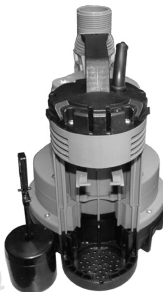
Obr. B: Čerpadlo s vyjmutým plovákem