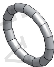
Těsnicí O-kroužek LBP