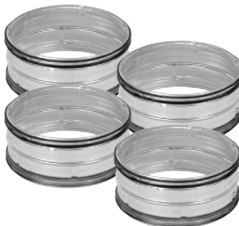
IVAR.AIR TOUCH DS