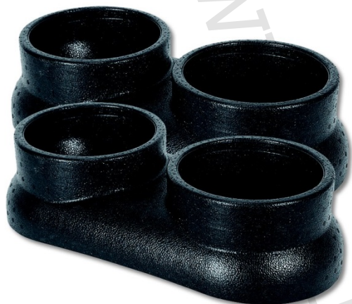
IVAR.AIR TOUCH DSI

2) Typ: IVAR.AIR TOUCH DS, IVAR.AIR TOUCH DSI