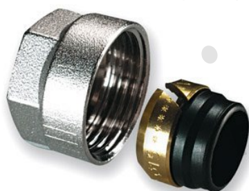
IVAR.TR 4430 IVAR.TR 430