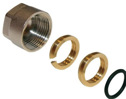
IVAR.TR 4430 CU 18x1 mm