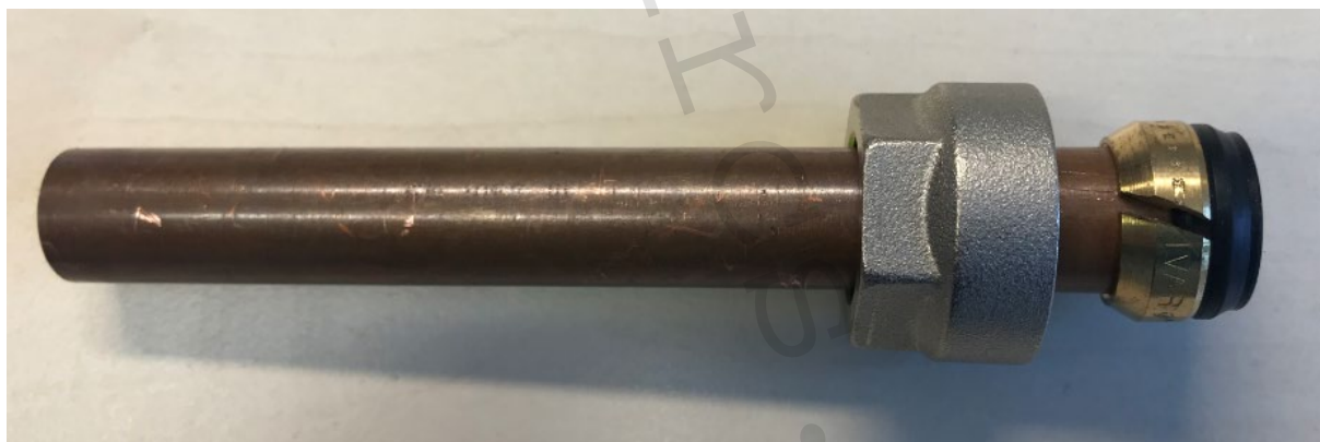
Obr. 2 ✗ Zlá inštalácia

Pri následnom doťahovaní musí byť vyvinutý ťahovací moment 45 \div 55 Nm na rozvodoch z mäkkej medi, 60 Nm až 80 Nm z tvrdej medi a 45 \div 70 Nm na rozvodoch z uhlíkovej ocele IVAR.C-STEEL. Armatúry musia byť vždy inštalované v systémoch s podmienkou dodržania všetkých prevádzkových parametrov a technických limitov uvádzaných výrobcom alebo jeho zástupcom napr. v technickom liste.